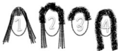
Figura 2: Representação de Transição Capilar

Desfazer-se por completo de uma progressiva significa passar pela transição capilar que é o período de tempo que uma pessoa que usualmente utilizava química para de realizar tais procedimentos enquanto novos fios de cabelos naturais vão nascendo até que todo o cabelo que possui química possa ser cortado. A transição capilar é a única e definitiva solução para desfazer uma progressiva.