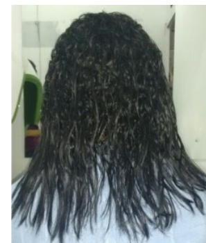
Figura 3: Cabelo parte natural e parte com química

O período de transição pode durar até anos dependendo do fator de crescimento e do comprimento desejado nos cabelos. A maior dificuldade nesse período é se acostumar com os cabelos mistos com duas texturas, parte já natural e outra parte do meio para as pontas ainda com a química.