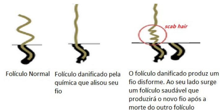
Figura 4: Radiografia do Scab Hair

após produzir o seu fio de cabelo morrerá e outro folículo sadio nascerá em seu lugar.